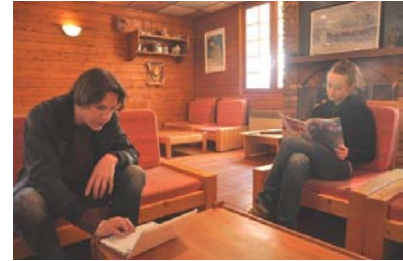
Le coin salon