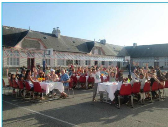
Centre UFOVAL 74

« Ecole Georges Le Bail » 30 avenue Georges Le Bail 29710 PLOZEVET Tél : 02.98.91.39.45 (bureau) Tél : 02.98.91.37.46 (restaurant)