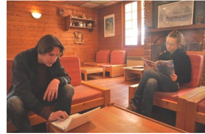
Le coin salon