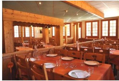
La salle de restaurant