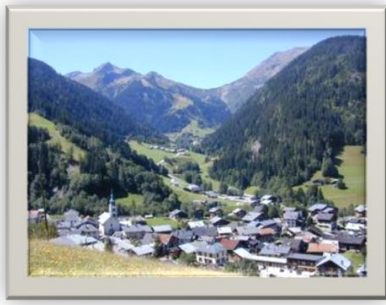
Le village d'Arêches