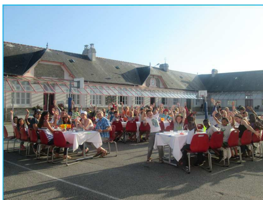
Centre UFOVAL 74

« Ecole Georges Le Bail » 30 avenue Georges Le Bail 29710 PLOZEVET Tél : 02.98.91.39.45 (bureau) Tél : 02.98.91.37.46 (restaurant)