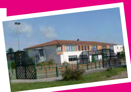
Lycée du Puits de l'Aûne Rue Louis Blanc 42110 FEURS

Les trajets entre Jas et le Lycée se font en autocar.