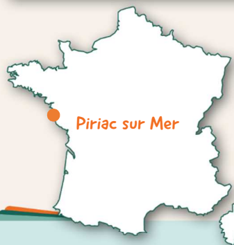
Piriac sur Mer

Pour changer de l'eau salée, deux séances au centre aquatique intercommunal seront proposées, ainsi qu'une séance au cinéma Atlantic.