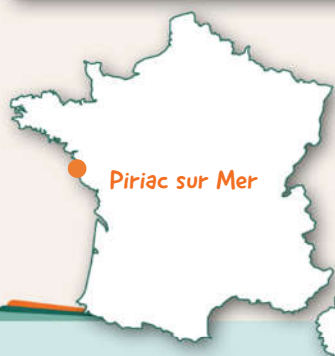
Piriac sur Mer

Une sortie au centre aquatique intercommunal est réservée. D'autres temps forts sont prévus tout au long du séjour: une demi-journée pour s'initier au Laser Tag, ou comment faire évoluer ses stratégies au fur et à mesure des matchs, se cacher, esquiver les tirs de ses adversaires... et une sortie à la demi-journée sur un voilier, où l'on pourra découvrir un panorama à 360° au mont Esprit... et revenir après avoir fait quelques emplettes souvenirs bien sûr! Bref, un séjour complet pour vivre une première colo "sur mesure" et rassurer parent et enfant.