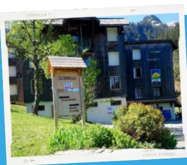
Chalet le Chornais 1000 montée du Chornais 73270 ARECHES-BEAUFORT Tél: 04.79.38.10.75 Chalet.chornais@fol73.fr

L'agencement des 33 chambres, équipées de sanitaires complets, a été pensé pour accueillir les jeunes dans des conditions maximales de confort.