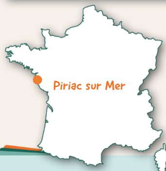
Piriac sur Mer

Bref, un séjour complet pour vivre une première colo "sur mesure" et rassurer parent et enfant.